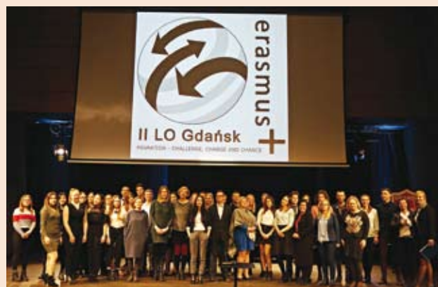
Pamiątkowe zdjęcie uczestników Gali

Podczas ogłaszania prelegentów, którzy mieli debatować, dostałem owacje całej sali, co już dodało mi pewności siebie i poczucia, że jestem w gronie „drugiej rodziny”.