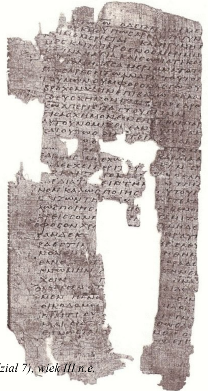
Strony papirusu P 15 I Listu do Koryntian (rozdział 7), wiek III n.e.