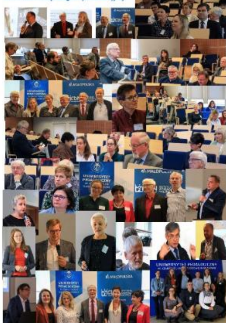
XXIII KDE Łódź, 2017