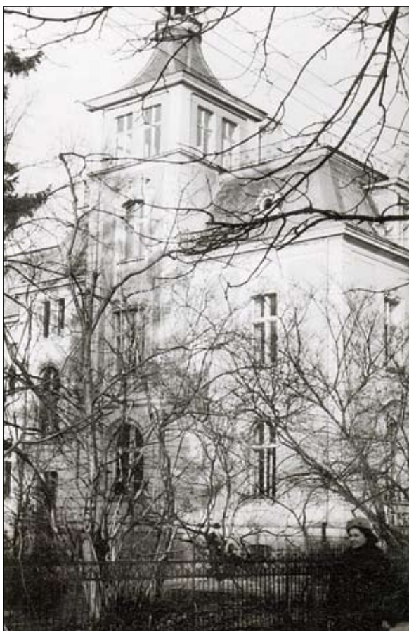
Fot. 2 Nowa siedziba OOM w Sopocie na ul. Wosia Budzisz 4