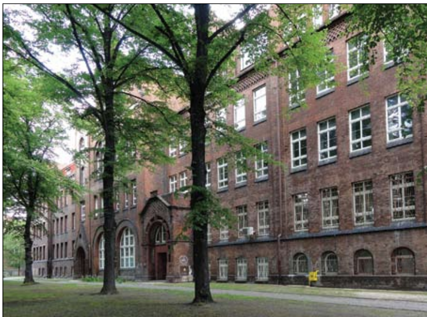
Fot. II Elewacja od ul. Leczkowa

Rozwój szkolnictwa. O szkołach w przedrozbiorowym Wrzeszczu brak wiadomości. Zapewne ich nie było. Po zajęciu okolic Gdańska w I rozbiorze Prusacy zaczęli zakładać szkoły elementarne typu wiejskiego. W 1785 powstała szkoła w Nowym Porcie, w 1787 we Wrzeszczu, w 1789 na Siedlcach, w 1793 w Świętym Wojciechu itd. Burzliwe czasy napoleońskie nie sprzyjały normalnej nauce. Po powrocie do Prus pojawiła się dwuklasowa szkoła (być może kontynuacja poprzedniej), związana z ewangelicką parafią Bo-