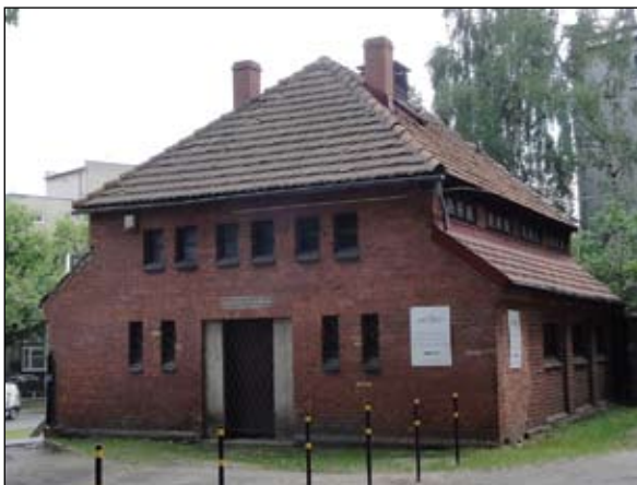
Fot. IV Po prawej: Dawne toalety dla uczniów