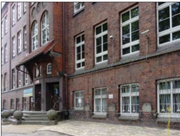
Fot. VI Portal dawnej szkoły męskiej. Między oknami parteru widoczne ślady po poidełkach

Między wojnami. Powstanie niepodległej Polski i utworzenie Wolnego Miasta Gdańska stworzyło podstawy do rozwoju gospodarczego. Na przeszkodzie stanęły dążenia nacjonalistycznych polityków do powrotu do Rzeszy. Zapewne dlatego w zasadzie nie zmieniano systemu szkolnictwa. W książce adresowej z 1929 r. znajdujemy we Wrzeszczu następujące placówki szkolne: 1) Politechnika Gdańska, 2) Conradinum, 3) Liceum Stephana Wätzholda, 4) „Liceum Niemieckie” ( Deutsches Lyzeum – dawna szkoła p. Sellmann) połączone z przedszkolem i seminarium dla przed-