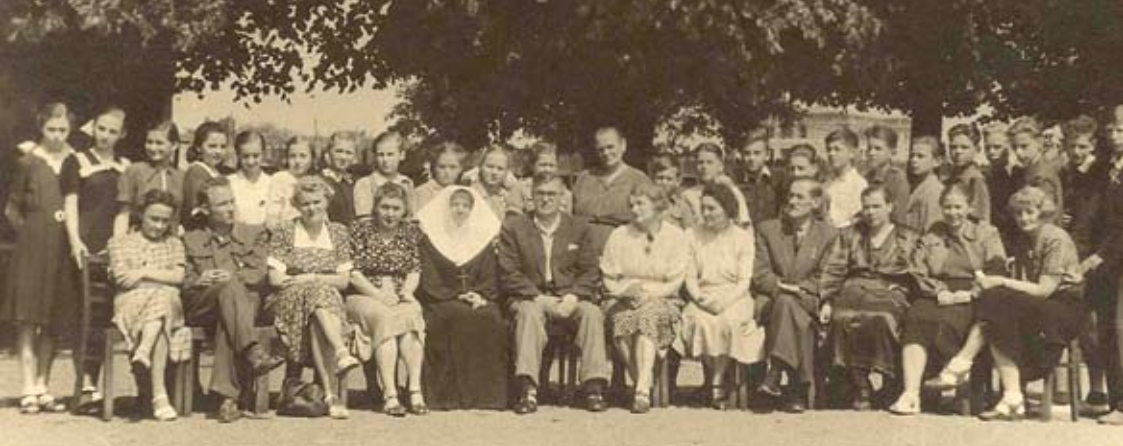
Grono pedagogiczne oraz uczniowie SP nr 28 – koniec lat 40.