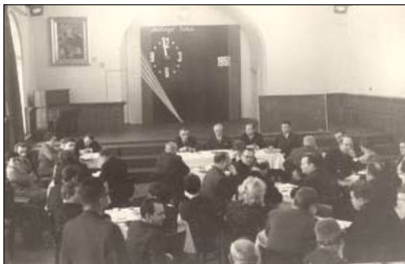
Fot. 4 Kurs dla aktywów oświatowego

2 OSIŃSKI, Zbigniew. Nauczanie historii w szkołach podstawowych w Polsce w latach 1944-1989... Uwarunkowania organizacyjne oraz ideologiczno-polityczne . Lublin 2010.