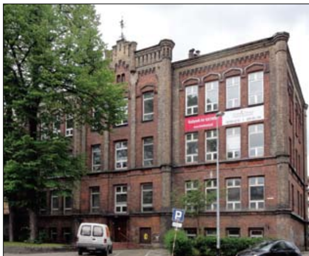
Fot. I Najstarszy szkolny budynek Wrzeszcza przy Dmowskiego 16a

Decydujące dla rozwoju Wrzeszcza było przeprowadzenie w 1870 r. kolei i budowa dworca. Od 1878 r. Wrzeszcz miał wodociągi, od 1896 kanalizację. W 1898 r. został podłączony do elektrowni na Ołowiance. W latach 1880-90 zaczęto wykupywać i parcelować ogrody i okoliczne majątki, wytyczono sieć nowych ulic, zaczęła się intensywne zabudowa. Powstała elegancka, pełna zieleni dzielnica. Cechą charakterystyczną były ogródki przed domami – obecnie w znacznej części zlikwidowane. W roku 1899