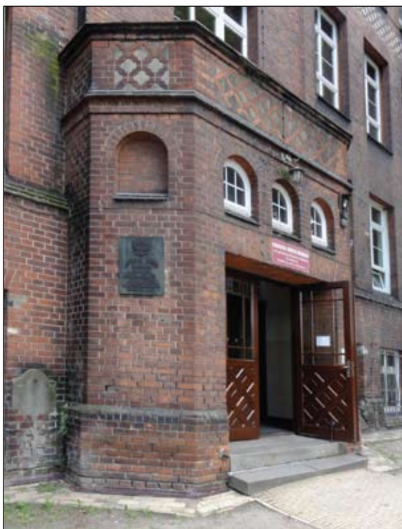
Fot. V Portal dawnej szkoły żeńskiej z powojenną tablicą

Wykaz szkół z roku 1911 wymienia ich w sumie 13: 1) Conradinum, z 22 klasami i ok. 500 uczniami 2) Królewską Szkołę Realną w organizacji (5 klas, 160 uczniów), 3) dawną szkołę panien Wilde, teraz Wätzold (10 klas, 300 uczniów), 4) „wyższą” (średnią) szkołę dla dziewcząt i chłopców pani Sellmann (13 klas, 405 uczniów i uczennic), 5) Szkołę Obwodową dla chłopców (19 klas, 840 uczniów), 6) Szkołę Obwodową dla dziewcząt (18 klas, 780 uczennic), 7) Szkołę Obwodową na Nowych Szkotach (22 klasy, 900 uczniów i uczennic), 8) Szkołę Obwodową w Strzyży Gór-