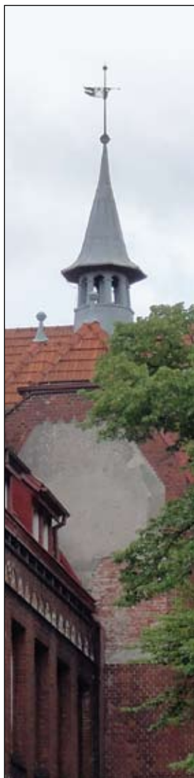
Fot. VII Wieżyczka na dachu

Rys. Plan szkoły na Nowych Szkołach z 1907 r. (Danzig u. seine Bauten)