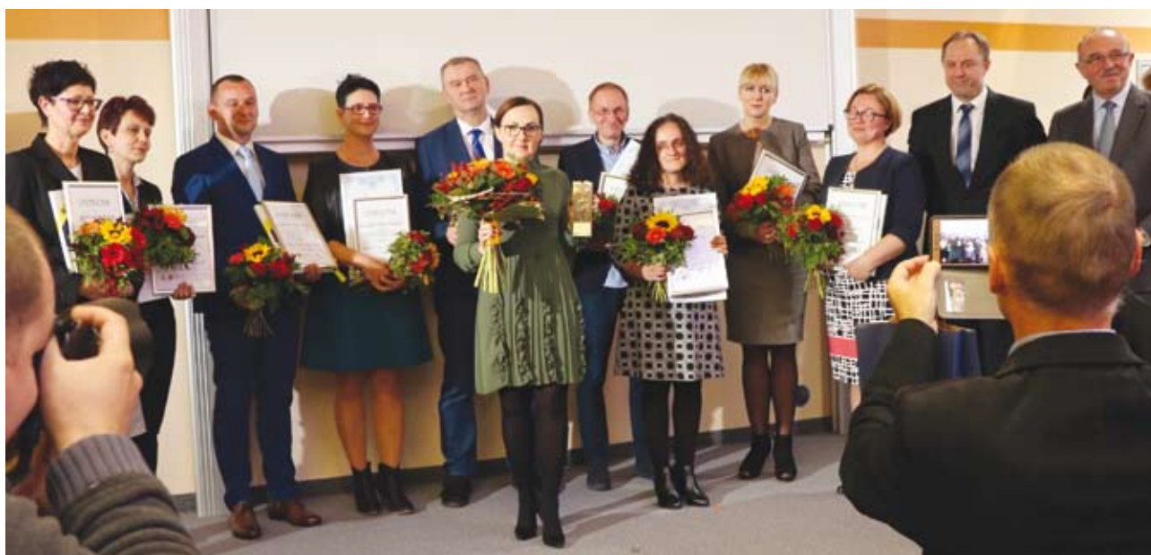
Rozdanie nagród w konkursie „Nauczyciel Pomorza 2017”

2 Podsumowanie I edycji konkursu oraz obszerny wywiad z Nauczycielem Pomorza 2016 ukazały się w nr 79 „Edukacji Pomorskiej” (s. 25-26 i 27-28).